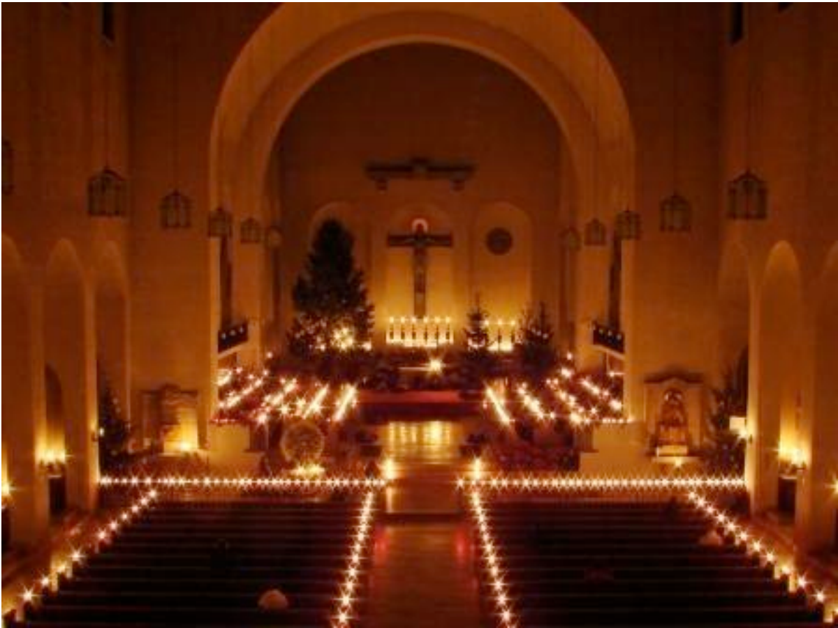
Silvesternacht in der Abteikirche von Münsterschwarzach

Auch in diesem Jahr waren wieder viele junge Menschen in die Abtei Münsterschwarzach gekommen, um den Übergang an Silvester vom Jahr 2011 zum Neuen Jahr 2012 ganz bewusst zu erleben und zu feiern. Im Jugendkurs waren es 54 TeilnehmerInnen (zwischen 16 und 30 Jahren) und im Parallelkurs ab 30 Jahren ca. 60 TeilnehmerInnen, die intensiv das vergangene Jahr 2011 reflektiert haben und in das Motto des Kurses „Wertvoll“ eingetaucht sind. In den verschiedenen Kleingruppen – „Stehen wir also endlich einmal auf“, „Wertvoll, kraftvoll, göttlich“, „Ich bin wertvoll – ICH BIN“, „Wertvoll – mein Weg“, „Heute besuche ich mich, hoffentlich bin ich zu Hause“, Du bist mein geliebtes Kind“, „Das Kind in mir“ – konnten die eigenen Lebensthemen erforscht und vertieft werden. Neben diesen Kleingruppen waren die Schweigewanderung nach Dimbach und dann vor allem wieder die schon fast legendäre Silvesternacht (Dauer: 4 Stunden) die absoluten Höhepunkte dieser Tage. Ein kleiner Auszug aus dem Teilnehmer-Feedback: